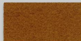
29 WALNUSS 29 WALNUT