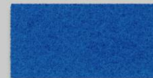
10 BLAU 10 BLUE