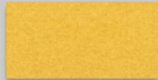
15 GELB 15 YELLOW