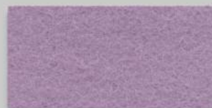
61 MALVE 61 MAUVE