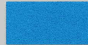
34 PETROL 34 PETROL