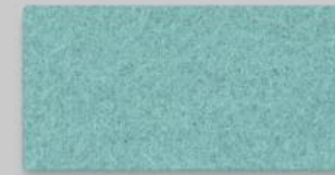
64 PASTELLTÜRKIS 64 PASTEL TURQUOISE