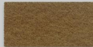
28 MOCCA 28 MOCCA