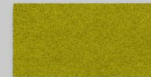
25 VERDE 25 VERDE