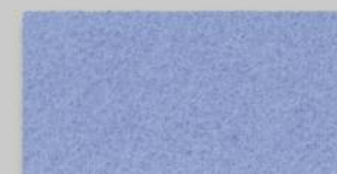
19 PASTELLBLAU 19 PASTEL BLUE