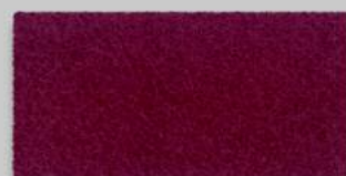
21 BORDEAUX 21 BURGUNDY