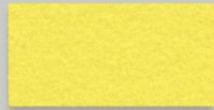
45 ZITRONE 45 CITRON