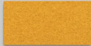
05 ORANGE 05 ORANGE