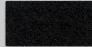
02 SCHWARZ 02 BLACK