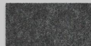
08 GRAPHIT 08 GRAPHITE

ALLE FARBEN SIND IN DEN MATERIALSTÄRKEN 2 MM, 3 MM UND 5 MM LIEFERBAR. DIE MATERIALSTÄRKE 8 MM IST IN DEN FARBEN 01, 02, 07, 11 UND 27 ERHÄLTlich.