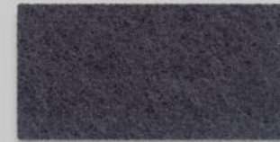
17 TAUBENGRAU 17 DOVE GREY