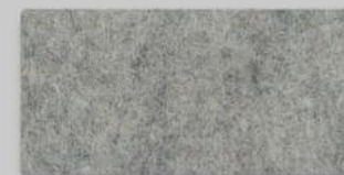
07 HELLMELIERT 07 LIGHT GREY MIXTURE