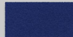
18 DUNKELBLAU 18 DARK BLUE