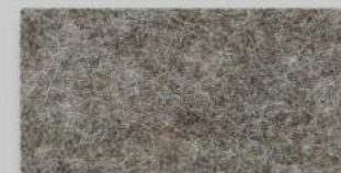
09 BRAUNMELIERT 09 LIGHT BROWN MIXTURE