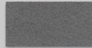
16 HELLGRAU 16 LIGHT GREY