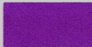
22 FLIEDER 22 LILAC