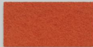
20 MANGO 20 MANGO