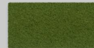
24 OLIV 24 OLIVE