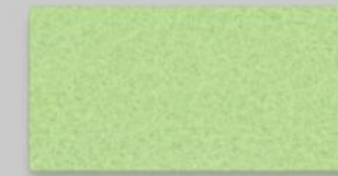
65 LEMON 65 LEMON