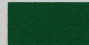
44 TANNENGRÜN 44 FIR GREEN