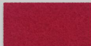
55 MOHNROT 55 POPPY RED