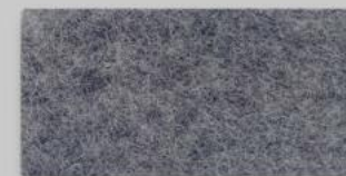
01 ANTHRAZIT 01 ANTHRACITE