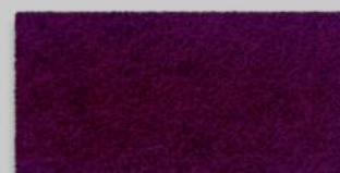
26 AUBERGINE 26 AUBERGINE