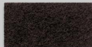
27 SCHOKO 27 CHOCOLATE