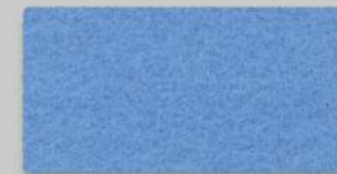
33 HIMMEL 33 SKY BLUE