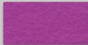
37 ROSA 37 ROSE