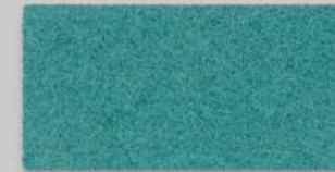
14 TÜRKIS 14 TURQUOISE