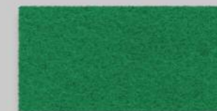
40 KLEEGRÜN 40 CLOVER GREEN