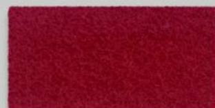
11 ROT 11 RED