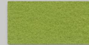
30 MAIGRÜN 30 MAY GREEN