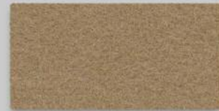
38 KARAMELL 38 CARAMEL